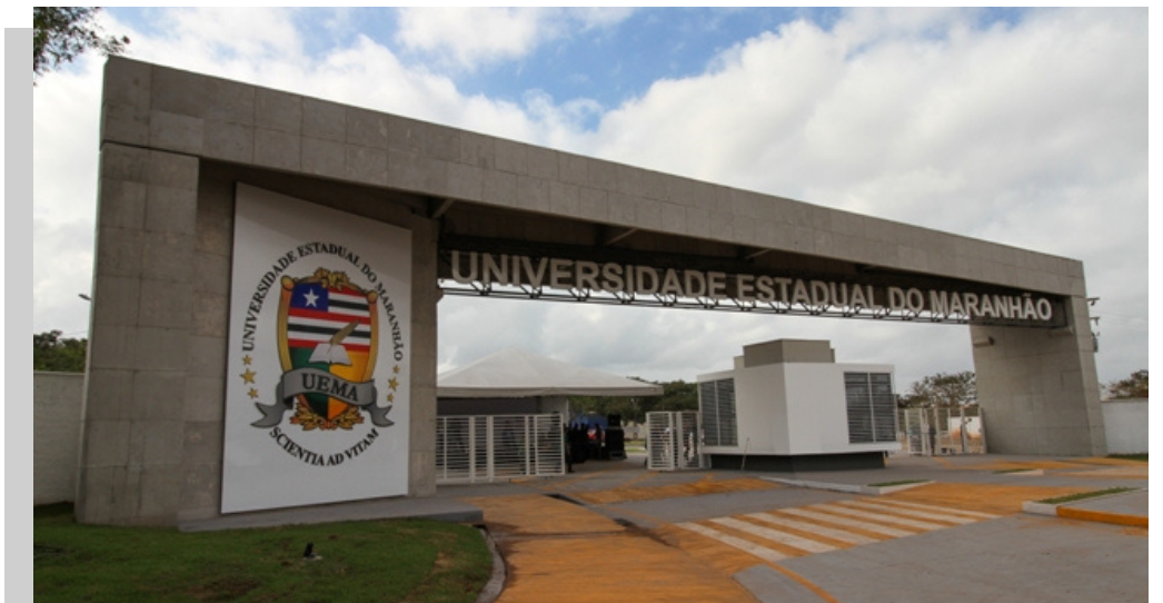
Pórtico de Acesso ao Campus

AGÊNCIA MARANDU - Área Construída: 731,40m 2 CECEN | HISTÓRIA - Área Construída: 3.188,81 m 2 CECEN | MÚSICA - Área Construída: 1.927,21m 2 CCSA | CENTRO CAXEIRAL - Área Construída: 757,75m 2 CCT | ARQUITETURA - Área Construída: 3.214,78 m 2