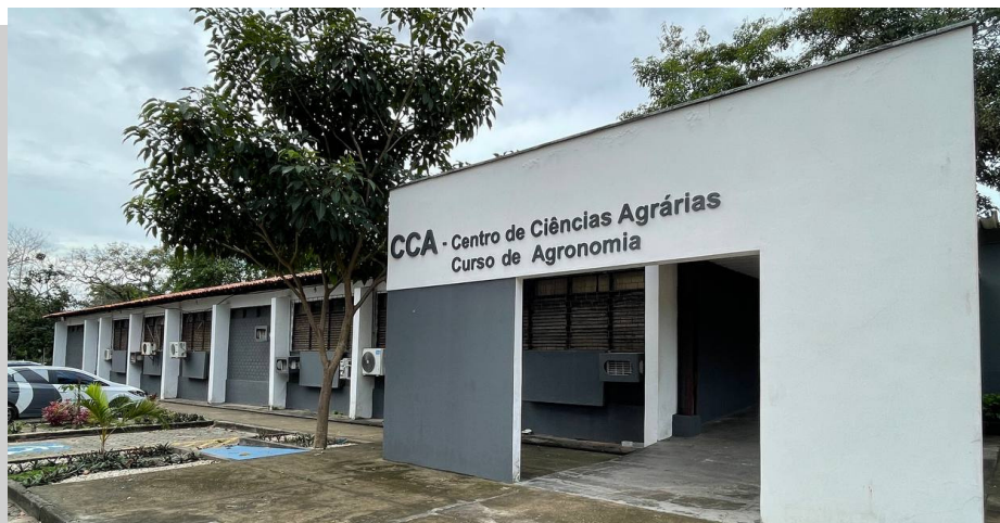
Fachada CCA-Prédio Sede