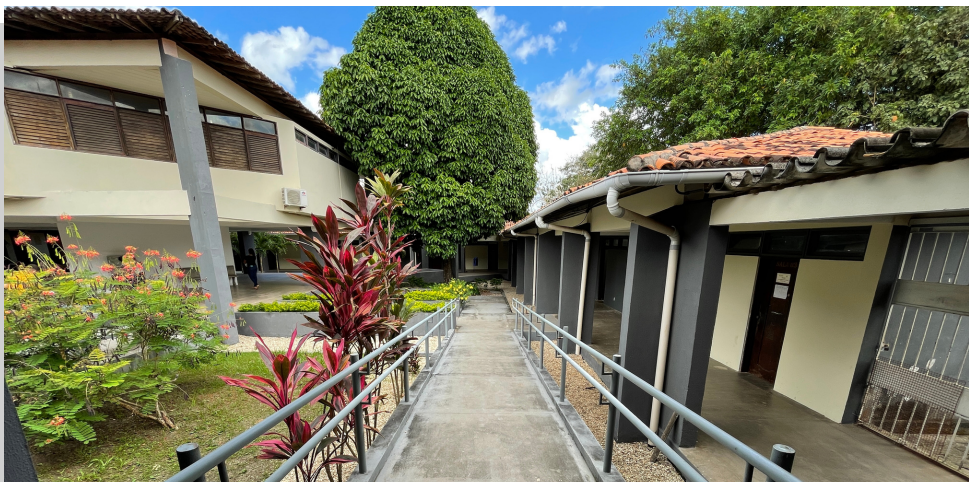
Área de Circulação