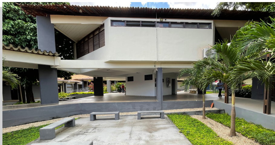
Área de Vivência - Jardim